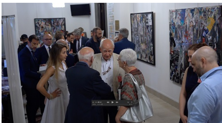
La sala espositiva con le opere di Nello Petrucci