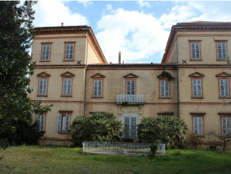
Villa Ciafardoni Giulianova