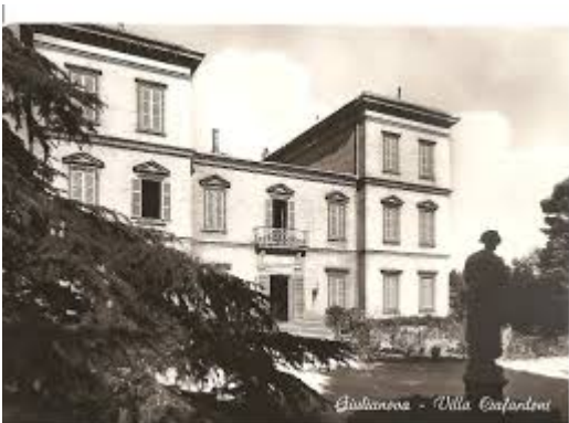
Villa Ciafardoni Giulianova