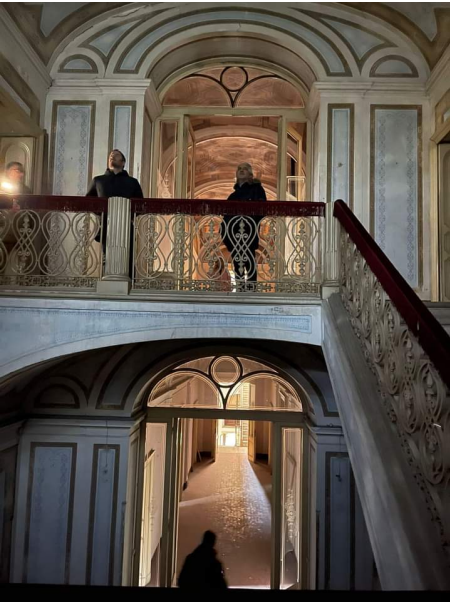
Villa Ciafardoni Giulianova