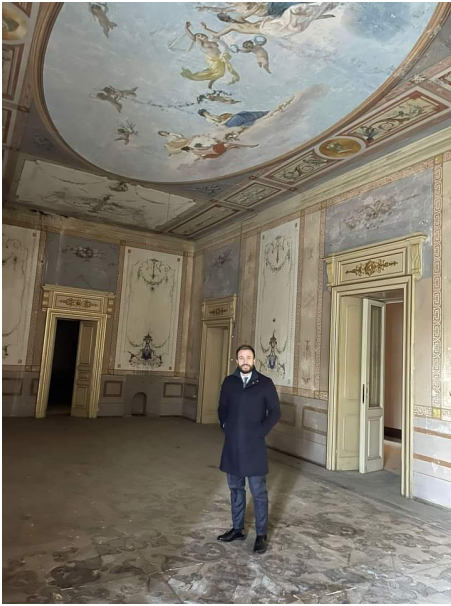
Villa Ciafardoni Giulianova