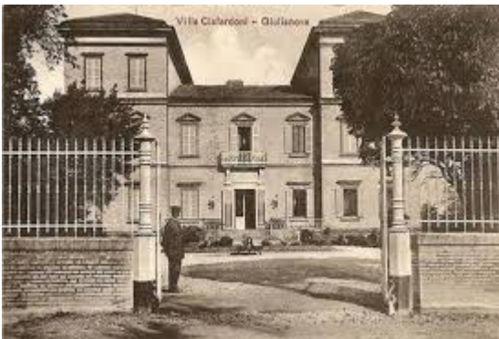
Villa Ciafardoni Giulianova