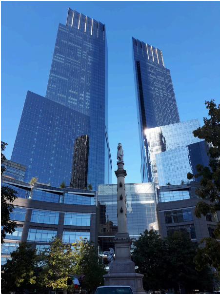
Monumento a Colombo al Columbus Circle