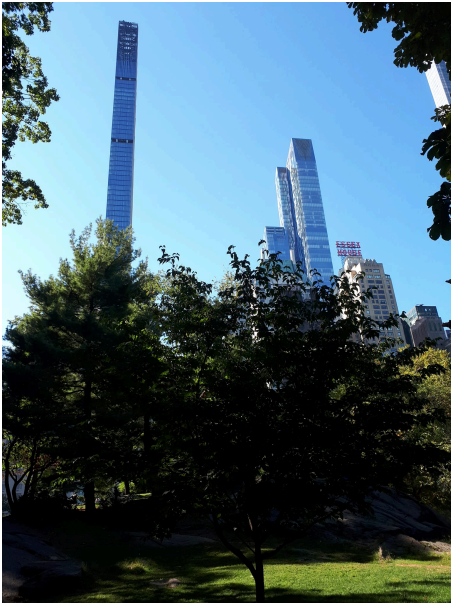
Central Park sud