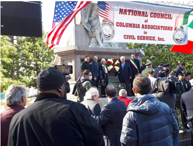
Proclamation Columbus Day