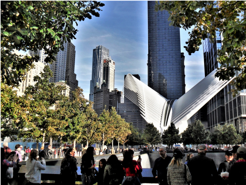
Ground Zero Memorial