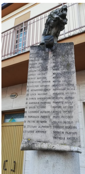
Monumento ai caduti di Cologna paese nella Prima Guerra Mondiale

Il 15 gennaio, dopo 6 anni di servizio della GdF viene definitivamente congedato. All'indomani dello scoppio della 1° Guerra Mondiale, il 27 maggio, viene chiamato alle armi in base al Regio Decreto del 22 maggio, n. 690 (Art. 1. E' indetta la mobilitazione generale del R. esercito e della R. marina e la requisizione quadrupedi e veicoli).