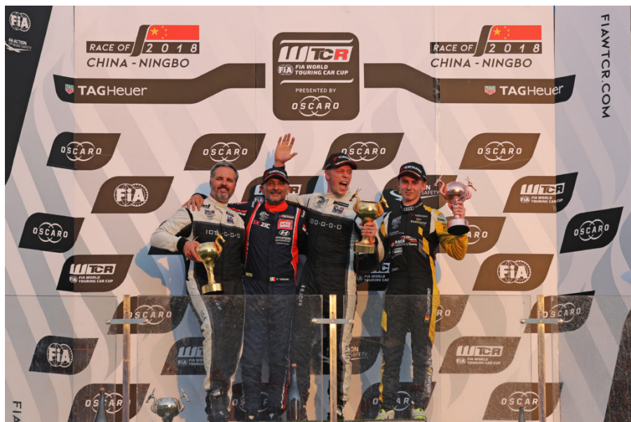
Tarquini sul podio 2018

Ad sola una gara dal termine della stagione inaugurale del FIA World Touring Car Cup (WTCR) 2018 si fanno sempre più concrete le possibilità di successo finale per Gabriele Tarquini e per il BRC Racing Team . Il driver abruzzese infatti è stato l'unico dei partecipanti ad accumulare punti in ognuna delle tre gare sul circuito giapponese di Suzuka, chiudendo il weekend con la sua quinta vittoria stagionale in un momento cruciale per il campionato.